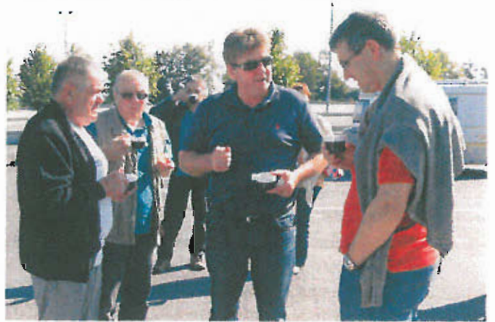
Pique-nique le samedi matin