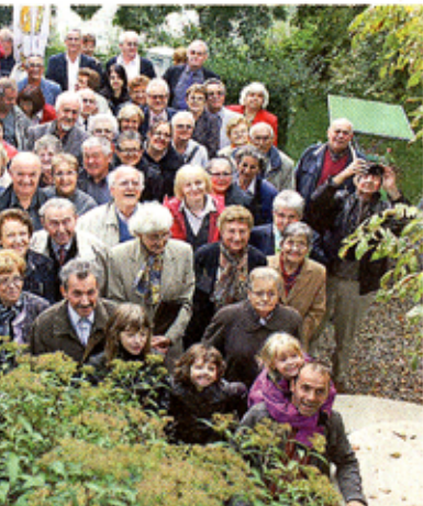
angehörige kamen in diesem Jahr.

schlag zu der nisieren auch stflug und ge- Vereinsnach- vereinsbeitra- ritz-Nachfol-